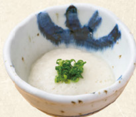
とろろ 100円 (税込110円)