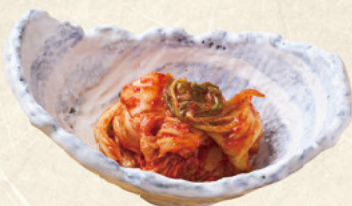
キムチ 100円 (税込110円)