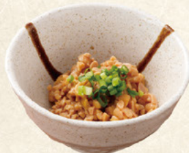
納豆 100円 (税込110円)