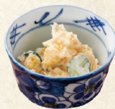
ポテトサラダ 100円 (税込110円)