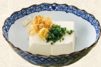
冷奴 100円 (税込110円)